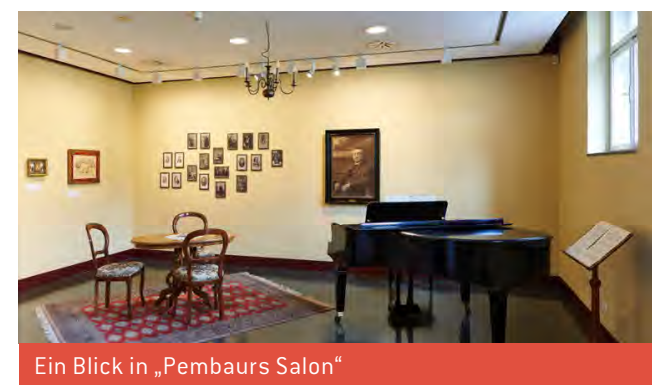
Ein Blick in „Pembaur's Salon“