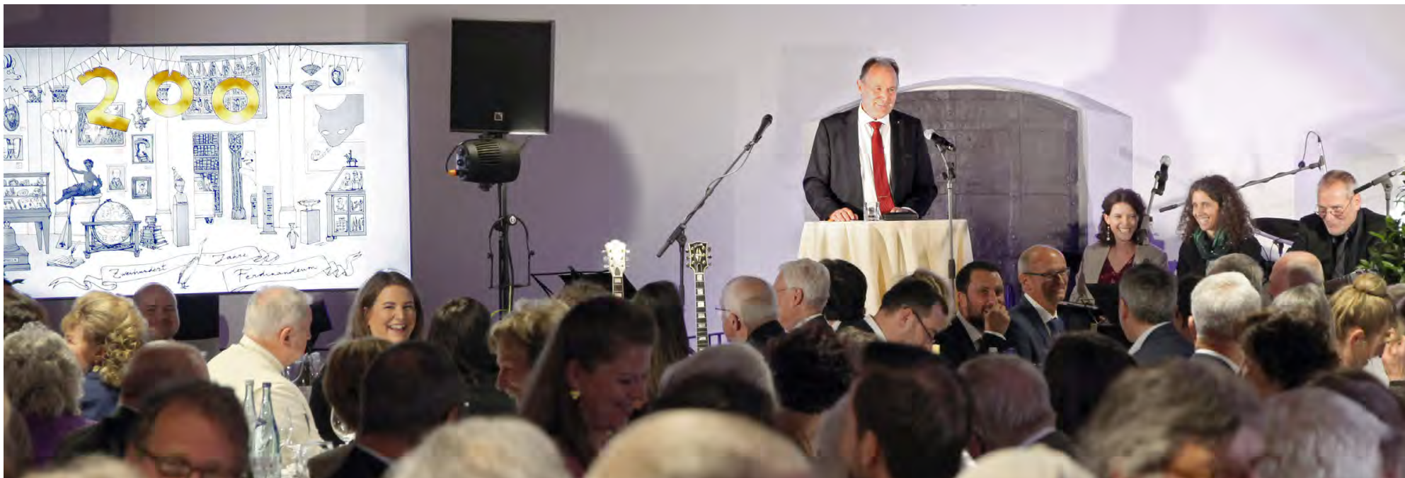
Impressionen von der Jubiläumsfeier

Einen Höhepunkt zum Jubiläum 2023 war die 200-Jahr-Feier für unsere Vereinsmitglieder und die Mitarbeiter:innen der Tiroler Landesmuseen am 12. Mai.