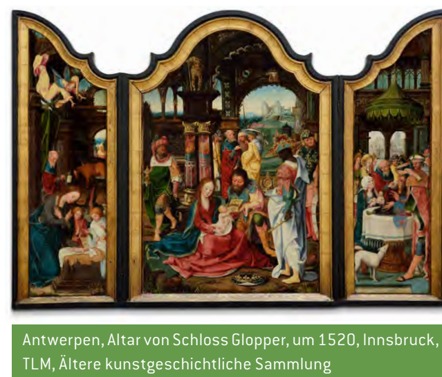
Antwerpen, Altar von Schloss Gloppe, um 1520, Innsbruck, TLM, Ältere kunstgeschichtliche Sammlung

Die Idee zu einer Ausstellung entsteht vor über zwei Jahren, als man noch davon ausgeht, dass der Umbau des Ferdinandeums im Jubiläum 2023 bereits begonnen habe. Um während dieser Umbauzeit die Sammlung und die Sammlungsgeschichte präsentieren zu können, wurde im Vorarlberg museum angefragt, ob Interesse an einer Ausstellung zu den Vorarlberger Objekten innerhalb der Sammlungen des Ferdinandeums besteht – die Initiative wurde gerne angenommen und das Ausstellungsprojekt nahm seinen Lauf.