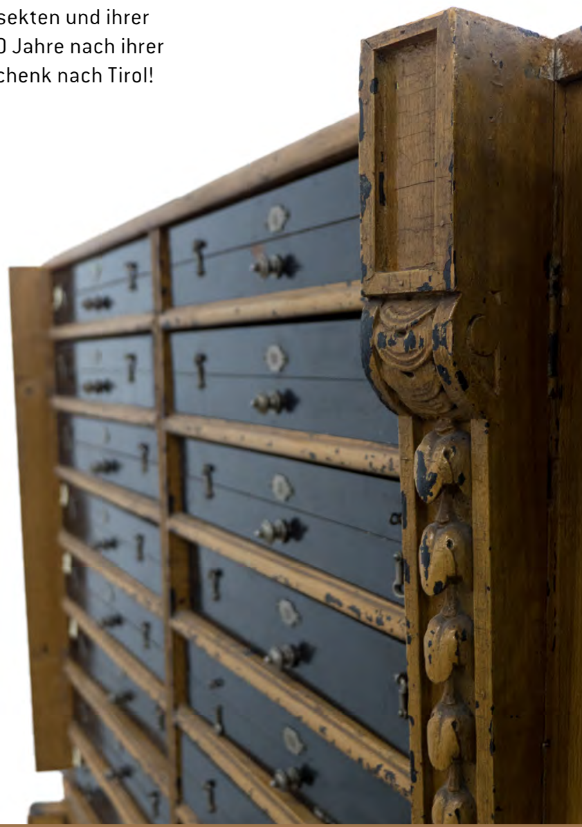
Die 1873 auf der Weltausstellung in Wien präsentierte Sammlung Wachtl umfasst 128 Ladenschränke.