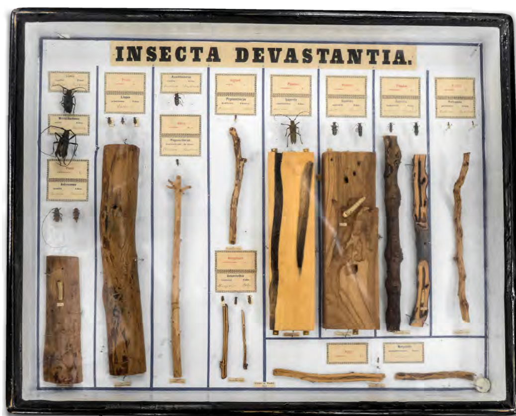
Wachtl war ein Meister in der Anfertigung von Präparaten diverser Fraßbilder.

Eine einzigartige Zusammenstellung von land- und forstwirtschaftlich relevanten Insekten und ihrer pflanzlichen Befallsbilder bereichert nunmehr die Bestände des Ferdinandeums. 150 Jahre nach ihrer Erstpräsentation bei der Weltausstellung in Wien geht die Sammlung Wachtl als Geschenk nach Tirol!