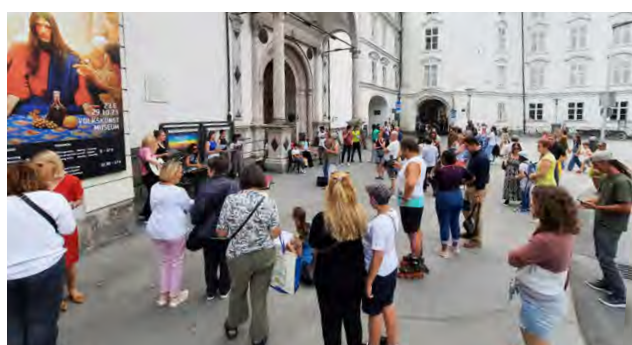
Fest der Vielfalt am 24. 6. 2023 im Volkskunstmuseum