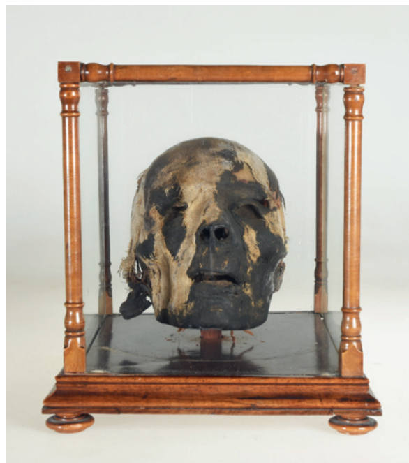
Archäologische Sammlung, ägyptischer Mumienkopf, Geschenk von Dr. Friedbert Scharfetter.