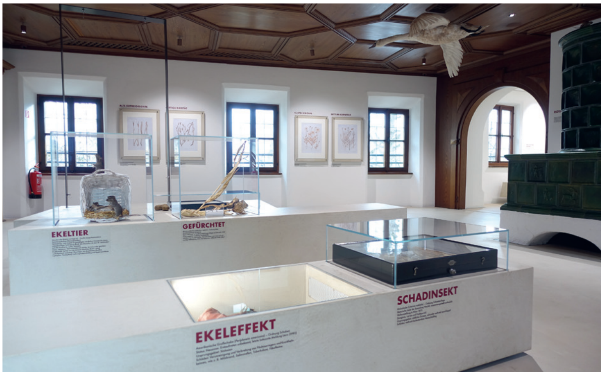
Die Jahresausstellung im Alpenzoo ermöglicht erstmals eine breite Öffnung der Naturwissenschaftlichen Sammlungen für die Bevölkerung und Gäste.

erhobenen Daten können wir wertvolle Erkenntnisse ziehen, die uns als Grundlage für das weitere Vorgehen gegen den laufenden Artenverlust und die Folgen des Klimawandels dienen.“ Das Aufsehen erregende Forschungsvorhaben fand auch medial bereits eine beachtliche Resonanz und wurde u. a. als Tiroler Beitrag zum ORF Schwerpunkt Mutter Erde ausgewählt. Zwei Projekteinreichungen im Rahmen des neu gegründeten Biodiversitätsfonds des Klimaministeriums wurden mit Verweis auf bereits ausgeschöpfte Mittel vorerst nicht genehmigt. Allerdings sind die Naturwissenschaften einer der wichtigsten Projektpartner des ersten bundesweiten Insektenmonitorings, das im Rahmen des genannten Fonds unter mehr als 200 Anträgen als eines von lediglich 14 geförderten Projekten ausgewählt wurde. In enger Kooperation mit dem Projektträger Institut für Ökologie der Universität Innsbruck (Johannes Rüdiger) werden vorerst von 2023 bis 2026 Tag- und Nachtfalter erhoben. Das Projekt weitet gleichzeitig die bereits seit vier Jahren im Rahmen des Vielfalter Projektes in Westösterreich durchgeführten Arbeiten deutlich aus. Eine wie gewohnt intensive Freilandforschung vor allem in der Botanik und Entomologie fokussierte sich auf unterschiedlichste