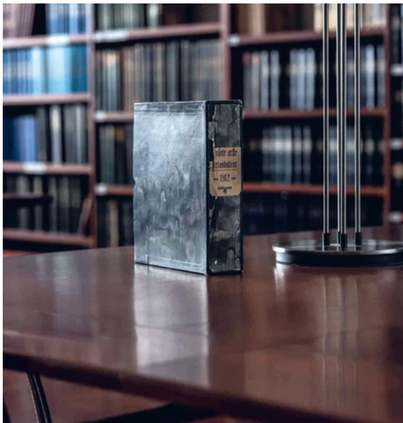
Ein Fotoalbum aus den Beständen der Bibliothek stand im Mittelpunkt einer Ausstellung im BTV Stadtforum.

Das Berichtsjahr war kein leichtes Arbeitsjahr, die Corona-Pandemie hat die Gesellschaft verändert und das Zusammenarbeiten vielfach in einen digitalen Raum verlegt. Umso schöner ist es, dass das Arbeiten in der Bibliothek in erster Linie aufgrund der hier Arbeitenden täglich große Freude macht, seien es die Angestellten, die Ehrenamtlichen oder die Benutzer*innen. Ihnen allen sei gedankt.