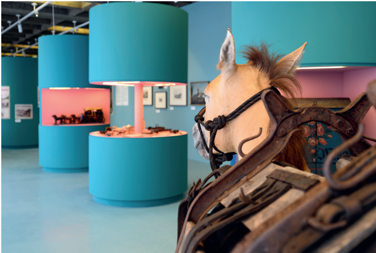
Blick in die Ausstellung „Gehen – Fahren – Reisen. Mobilität in Tirol“ im Museum im Zeughaus.