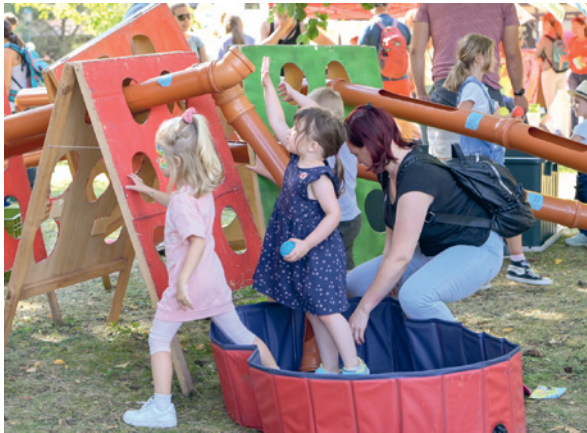
Bergiselfest am 12. September 2021.