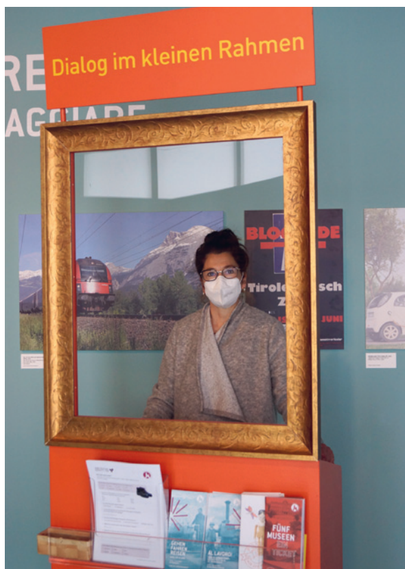
Kulturvermittlung im kleinen Rahmen beim Eröffnungsfest des Euregio-Museumsjahres, 29. Mai 2021, Zeughaus.