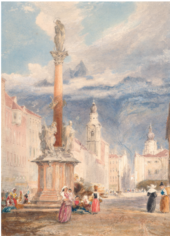
James Holland, Die Anna-Säule in Innsbruck, 1858, Aquarell über Bleistift auf Papier.

überlassen. Diese Sammlung umfasst Objekte aus der Zeit vor dem zweiten Weltkrieg bis zur Jahrtausendwende.