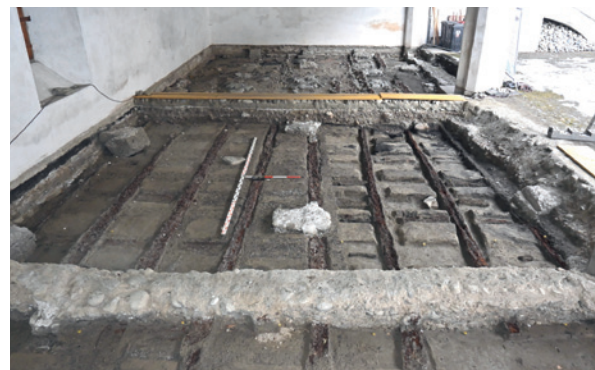
Museum im Zeughaus, Südwestarkade 2, in Lehm eingetiefte Gräbchen mit Resten von Rundstämmen.