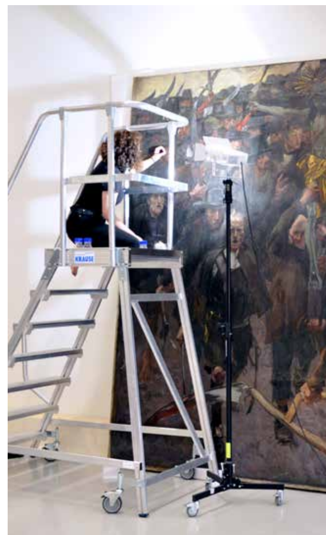
Fehlstellenbehandlung des großformatigen Gemäldes „Das Kreuz“.

Der schlechte Erhaltungszustand und die Beeinträchtigung der Lesbarkeit des Gemäldes erforderten eine konservatorisch-restauratorische Behandlung. Im Mittelpunkt des Material- und Methodendiskurses standen konservatorische Maßnahmen zur Bestandserhaltung und in weiterer Folge zur Optimierung des ästhetischen Erscheinungsbildes des Gemäldes wie die trockene und feuchte Oberflächenreinigung, Festigung der Bildschichten, Rückformung der Deformierungen, Behandlung der Risse und Löcher des textilen Bildträgers, Aufspannung sowie die Behandlung der Fehlstellen. Der Fokus der praktischen Arbeit lag in der Abnahme der alten Leinwandstreifen und der Findung einer geeigneten Aufspannungsmethode für das großformatige Leinwandgemälde. Dabei wurde auf eine allgemeine Gewichtsreduktion Wert gelegt, welche ein Handling des großformatigen Werkes erleichtern sollte. So wurde der alte hölzerne Keilrahmen durch einen modernen keilbaren Aluminiumrahmen ersetzt. Für eine neue Anränderung, die zur Aufspannung des Gemäldes nötig war, wurden Zugfestigkeitsprüfungen an der Technischen Prüfungsanstalt in Wien (TPA) mit diversen in der Restaurierung häufig zum Einsatz kommenden Klebmitteln durchgeführt. Schließlich wurde als