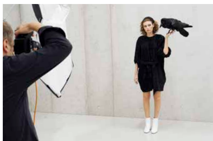
Fotoshooting für die Herbstausgabe der Frauenzeitschrift „maya“, SFZ, 4.9.2019