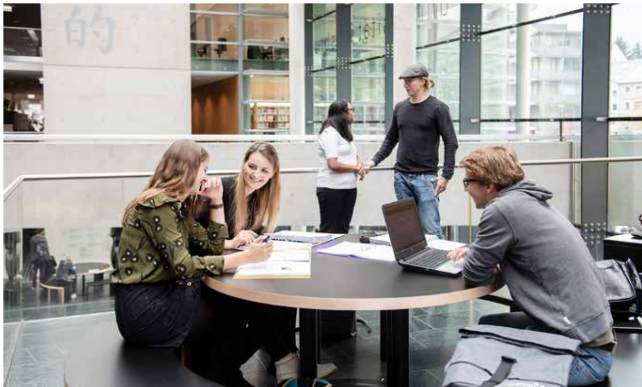
Studierende können in Innsbruck aus über 170 Studienmöglichkeiten wählen.

An der Universität Innsbruck gibt es mehr als 170 Studienmöglichkeiten an 16 Fakultäten: Die Studierenden profitieren in allen Ausbildungsphasen von der forschungsgeleiteten Lehre an der Universität Innsbruck, denn durch den Unterricht durch aktive ForscherInnen fließen die neuesten Ergebnisse direkt in die Lehre ein. Auch berufsleitend bietet die Universität Innsbruck Lehrgänge, Kurse und Seminare. Dabei legt sie besonders Wert auf die praxisnahe Vermittlung von aktueller Forschung, etwa durch