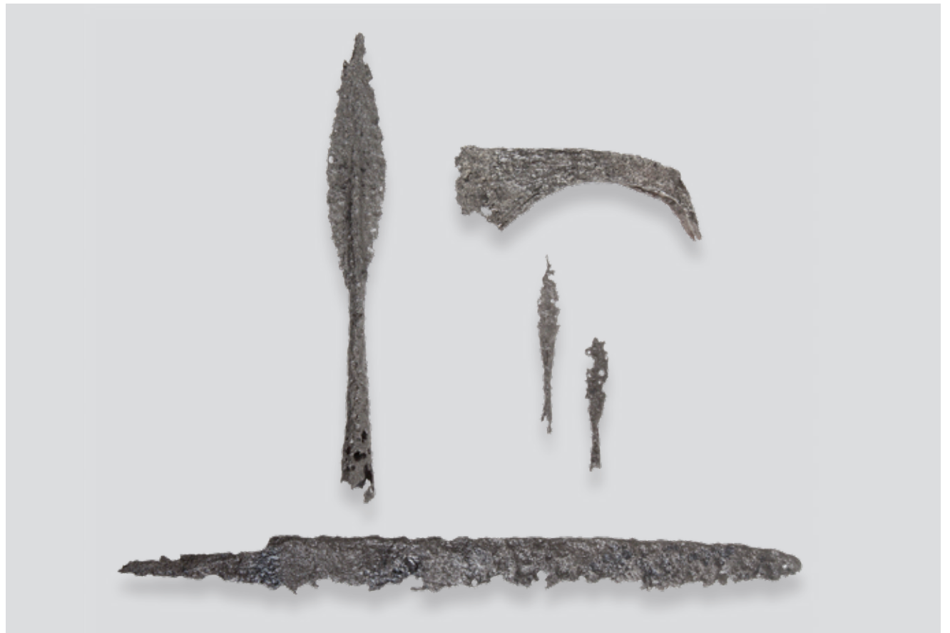
Waffenensemble aus Lienz (?): Sax, Franziska, Lanzen spitzen aus der Sammlung Franz Tappeiner, Schenkung 1891.

Bereits während des Studiums manifestierte sich der Forscherdrang: In den späten 1830er-Jahren widmete er sich intensiv der Botanik, 1842 schenkte er dem Ferdinandeum sein Herbar mit 3.624 Artenbelegen. Den Weitblick als Arzt bezeugt einerseits für 1855 anlässlich des Choleraausbruches der Aufruf „Liebe Landsleute ...“ mit Erläuterung des Krankheitsbildes und Hinweisen auf erforderliche Hygienemaßnahmen, andererseits in den 1870er-Jahren sein Forschungsergebnis zur Lungentuberkulose mit dem Nachweis ihrer Übertragung durch Infektion, durch Inhalation phthisischem Sputums. Diesbezügliche Versuche an Hunden im pathologisch-anatomischen Institut in München und in Berlin unterstützte wesentlich der renommierte Mediziner, Pathologe und Anthropologe Dr. Rudolf Virchow. Gerade die engen Kontakte mit der 1869 gegründeten Deutschen Anthropologischen Gesellschaft in Berlin, deren Mitbegründer Rudolf Virchow war, und der 1870 gegründeten Anthro-