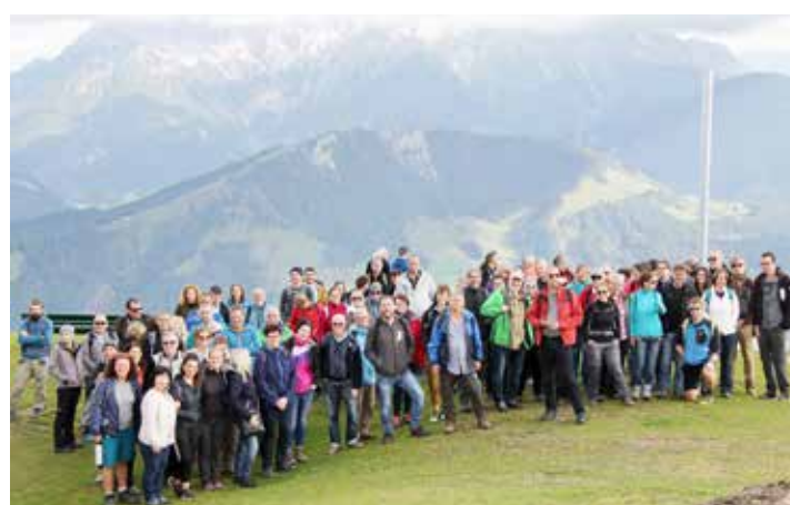
Betriebsausflug nach Fieberbrunn, 30.9.2019