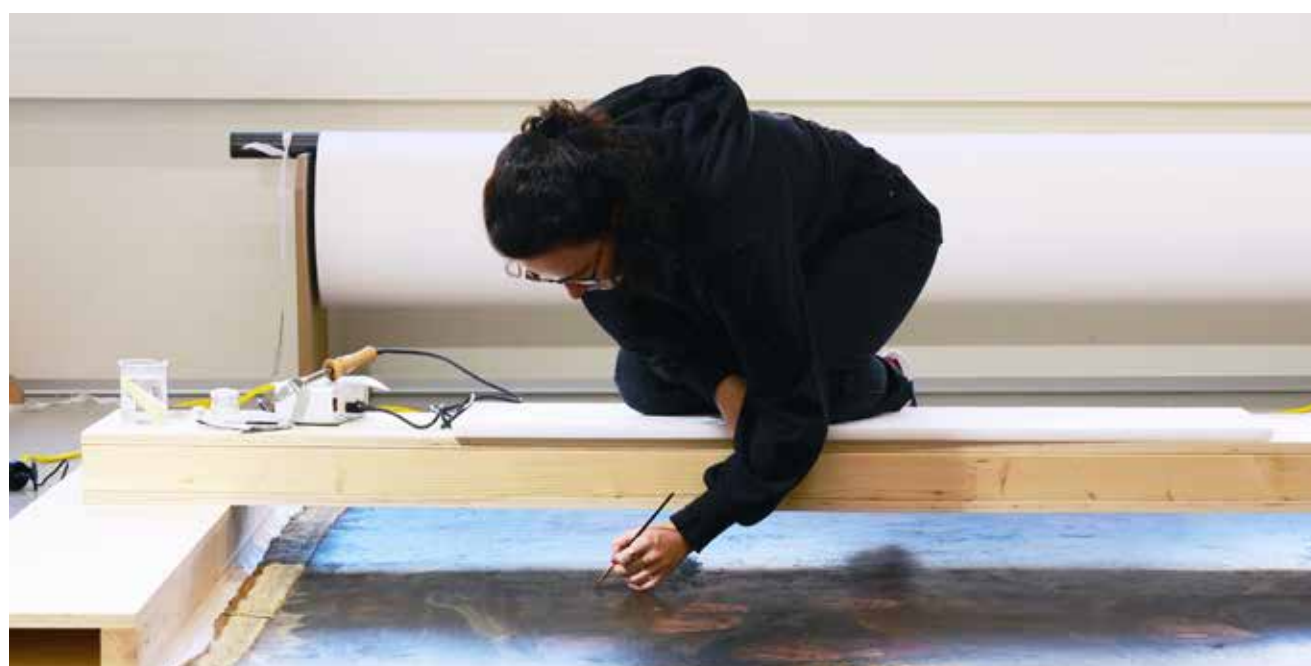
Bei der Festigung der Malschicht wurde mit feinen Pinseln ein Klebmedium aufgetragen.