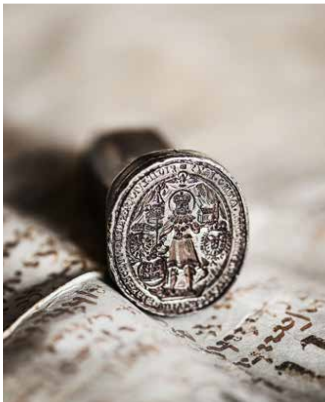
Die Universität feiert in diesem Jahr ihr 350-Jahr-Jubiläum.

Im Jahr 2019 feiert die Universität Innsbruck ihr 350-jähriges Jubiläum. Das Programm ist bunt, auch das Ferdinandeum leistet einen wichtigen Beitrag.