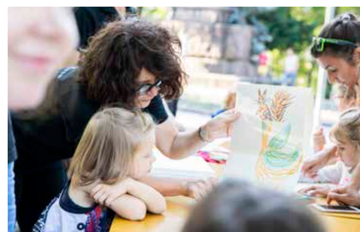
Kinderwerkstatt beim Bergiselfest, 15.9.2019