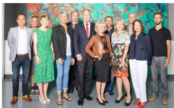
Der neue Aufsichtsrat der Tiroler Landesmuseen-Betriebsgesellschaft, 8.8.2019