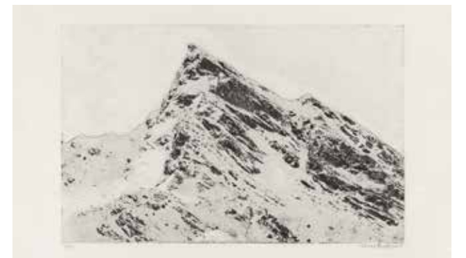
Elmar Peintner, OE Nr. GAR 422, Ohne Titel, 2019, Radierung auf Zerkall Bütten

Auflage: 11, Format: 50 x 35 Liebhaberpreis: 7.500 Euro + 10 % MwSt.