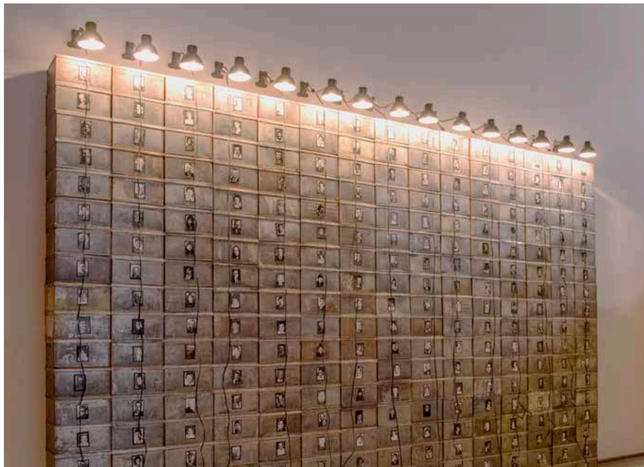
Auch eine Arbeit von Christian Boltanski, dem ab November eine Personale im Centre Pompidou ist, gewidmet ist, findet sich in der Ausstellung.