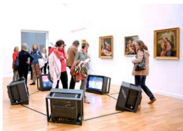
„Schönheit vor Weisheit“, Ferdinandeum, Eröffnung, 26.9.2019

ALBRECHT DÜRER Albertina, Wien www.albertina.at noch bis 6.1.