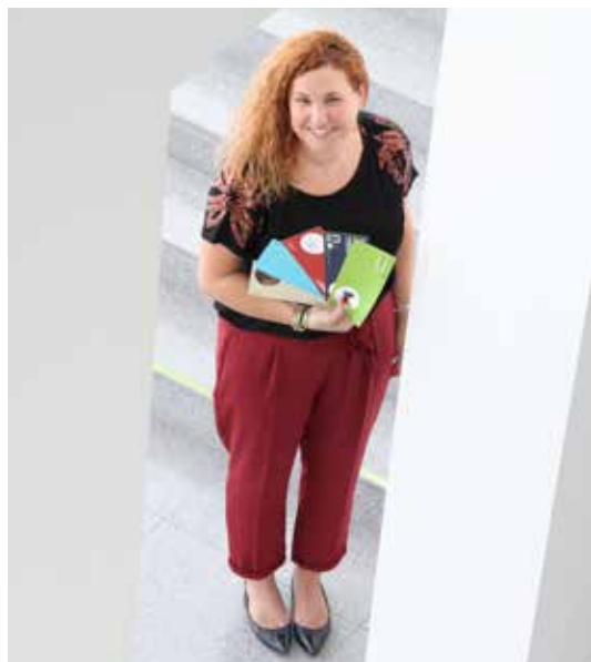
Bitte kontaktieren Sie mich für das passende Kulturvermittlungsangebot.

Am 1. November feiere ich mein einjähriges Jubiläum in der Abteilung Besucherkommunikation. Ein Verlängerter mit einem Glas Wasser und eventuell ein Schokoriegel dürfen auf meinem Schreibtisch nicht fehlen, besonders montags. Ab 9 Uhr empfangen unsere BesucherInnen am Telefon, via E-Mail und manchmal auch persönlich. LehrerInnen erkennen mich sogar schon im Kino, weil ich ihnen vielleicht einen unserer Archäologie-Museumskoffer zur Ausleihe vorbereitet habe. In der Buchhaltung, im Sekretariat der Direktion, in der Bibliothek und natürlich auch bei den KassenmitarbeiterInnen bin ich gut bekannt. Ich bin die Erste, die Sie telefonisch begrüßen darf, wenn Sie die Durchwahl 111 wählen und diejenige, die Ihren Wunsch an unsere KulturvermittlerInnen weiterleitet: „Wir haben eine neue Führungsanfrage!“ Die Informationen sollen optimal zwischen den Kulturinteressierten außerhalb und den KulturvermittlerInnen innerhalb des Museums transportiert werden. Dabei bearbeite ich nicht nur Anfragen zu Führungen, sondern auch zu anderen Formaten. Während der Schulzeit versuche ich, den LehrerInnen die passenden museumspädagogischen Aktionen, dialogischen Führungen oder Workshops anzubieten.