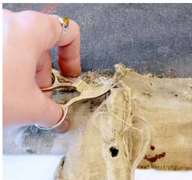
Mechanische Abnahme der alten Leinwandstreifen, welche zur Aufspannung des Gemäldes dienten.

Im Zuge der Auseinandersetzung mit dem kunst- und kulturgeschichtlichen Hintergrund des Gemäldes erfolgte eine intensive Beschäftigung mit dem Leben und Werk des Malers Albin Egger-Lienz. Basierend auf den Standardwerken des künstlerischen Œuvres, konnten die thematischen Schwerpunkte des Malers entschlüsselt werden. Neben der profanen Thematik des bäuerlichen Lebens war die Auseinandersetzung mit dem Krieg im Allgemeinen ein immer wiederkehrendes Thema von Egger-Lienz. Im Hinblick auf das hier zu bearbeitende Gemälde, welches eine Szene der Tiroler Freiheitskämpfe von 1809 darstellt, wurde auch auf die künstlerische Beschäftigung mit dieser Thematik eingegangen.