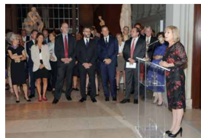
Der Verein als Hauptleihgeber im MET, New York, Eröffnung, 2.10.2019