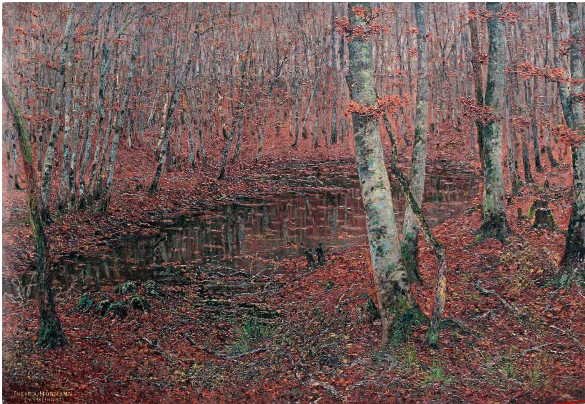
Theodor von Hörmann, Tümpel im Buchenwald, 1892, Öl auf Leinwand, 70,5 x 102 cm, Inv.-Nr. Gem 487.