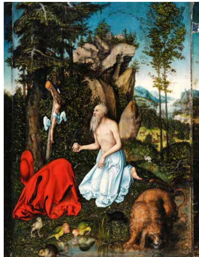
Lucas Cranach d. Ä., Hl. Hieronymus, um 1525, Malerei auf Holz, TLMF, Inv.-Nr. Gem/116.

Diese Fragen sind es, die den Besucher durch die Ausstellung leiten. Dabei steht – bestückt mit wichtigen Leihgaben aus verschiedenen Schaffensphasen des Malers – die Werkgruppe der Hieronymusbilder mit ihrer Naturdarstellung im Mittelpunkt. Hier eröffnet sich ein breiter Horizont: Zum einen wirkt bei Cranach die Symbolik des Mittelalters weiter, in der jede Pflanze, jedes Tier eine geheime Bedeutung hatten. Zum anderen offenbart sich ein neuer Realismus, der im Kontext der noch jungen Naturwissenschaften seinen Ort findet. Diese beiden Sichtweisen von Flora und Fauna treffen in Cranachs Hieronymusgemälden spannungsvoll aufeinander – und sorgen für ein intensives Ausstellungserlebnis.