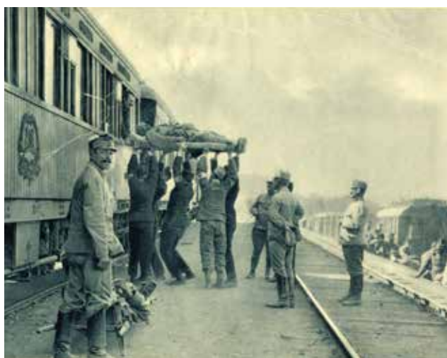
Verwundetentransport in Galizien mit dem Schlafwagen des Orient-Express, ca. 1915.