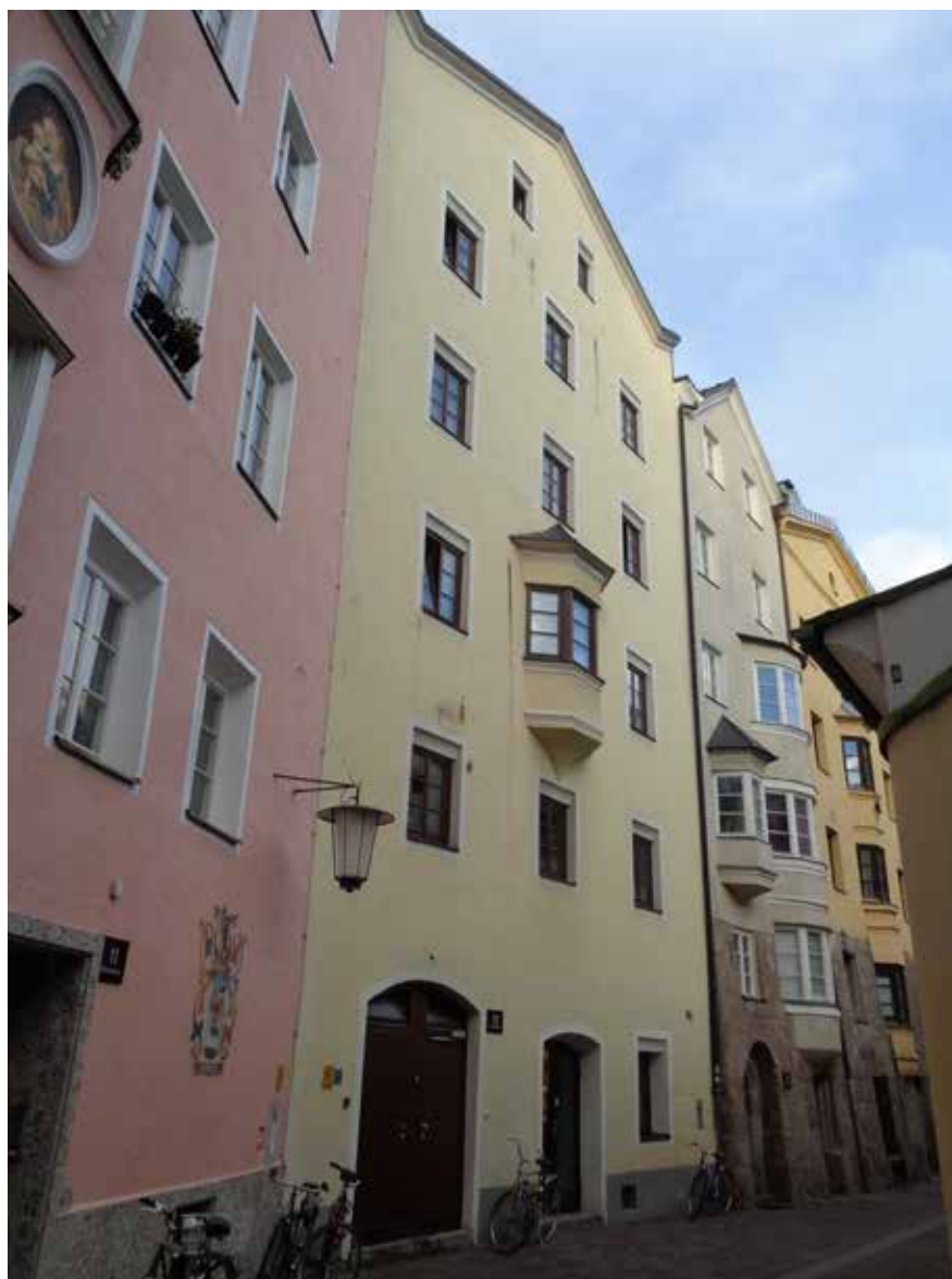
Die Offizin Reisachers befand sich in der Schlossergasse Nr. 13.

Innsbruck StudienVerlag, ISBN 978-3-7065-5659-0 Preis: 34,90 Euro