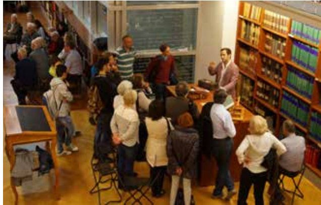
Stationen der Medizingeschichte, Auftakt der Veranstaltungsreihe 2017, Bibliothek

Auch im Jahr 2018 versucht das Team der Bibliothek des Ferdinandeums wieder, mit interessanten Veranstaltungen ein möglichst breites Publikum für die Kultur-