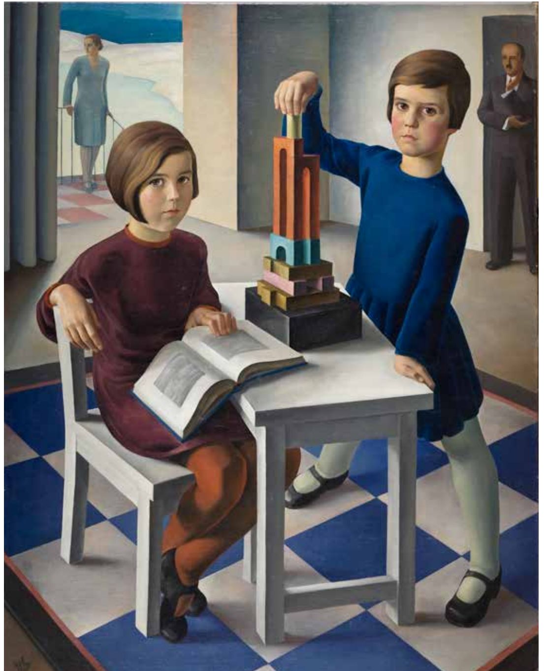
Abb. li. oben: Ernst Nepo, Bildnis Ditta Keller, 1929, Kohle auf Papier, 395 x 295 mm, Inv.-Nr. N/196. Abb. li. unten: Ernst Nepo, Bildnis Dora Keller, 1929, Kohle auf Papier, 395 x 295 mm, Inv.-Nr. N/195. Abb. re.: Ernst Nepo, Familienporträt Keller (oder Keller-Kinder), 1929, Öl auf Leinwand, 145,6 x 114,5 cm, Inv.-Nr. Gem/3371.