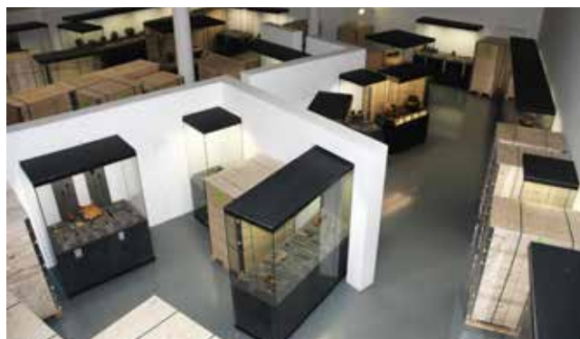
Die mit Transportpaletten bestückte archäologische Schausammlung vor der Übersiedlung.