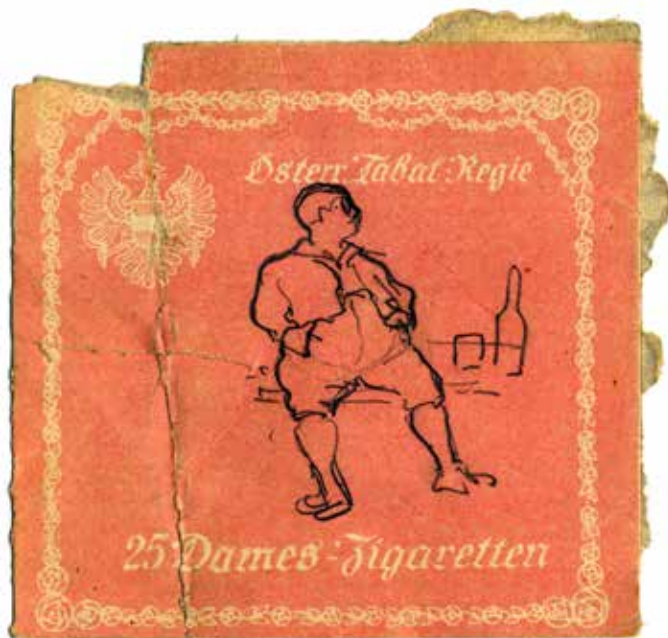
Neben kleineren Aquarellen finden sich im Teilnachlass des Ferdinandeums auch gelungene Karikaturen aus der Feder Pölls. TLMF, Bibliothek/Nachlasssammlung, Nachlass Josef Pöll

Auf all seinen Wanderungen führte Pöll sein „Schmierbüchl“ mit, in das er naturkundliche, musikalische und dichterische Notizen eintrug. „Wenn man so allein dahinwandert, da fallen einem so manche Versln und Melodien ein, die man dann zuhause recht gut verarbeiten kann!“ Hier zu sehen u. a. der sog. „Falkenträger“ an der Arzler Scharte. TLMF, Bibliothek/Nachlasssammlung, Nachlass Josef Pöll