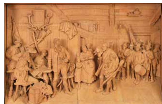
Der Bauer und die Moderne Tiroler Landesmuseum Ferdinandeum Tagung, 13.–14. April 2018

Hans Pitschmann nach Franz von Defregger, Josef Speckbacher und sein Sohn Anderl, 1903, Inv.-Nr. P 1207.