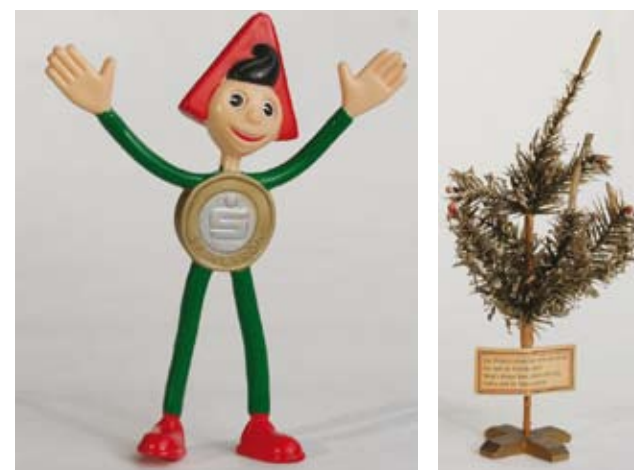
„Sparefroh“ – Figur mit Euro-Münze, 2007