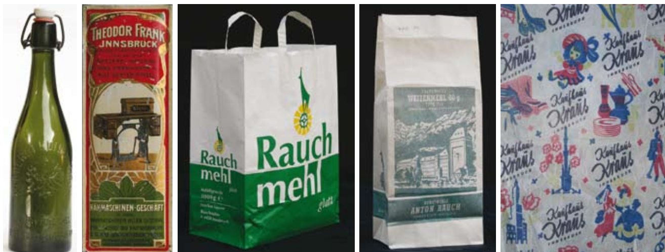
Bierflasche der Brauerei Kundl, um 1910