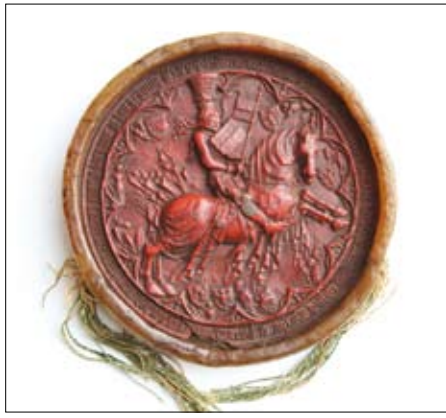
Großes Reitersiegel Herzog Rudolfs IV. des Stifters, in dessen Regierungszeit die Grafschaft Tirol im Jahr 1363 an den habsburgischen Länderkomplex angeschlossen wurde.