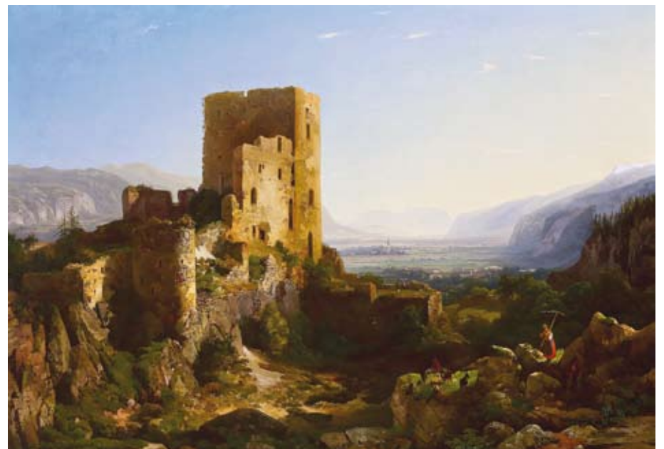
Thomas Ender, Blick von der Ruine Rattenberg ins Unterinntal , 1858, Öl auf Leinwand,