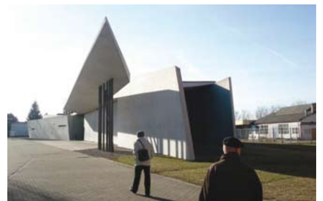
Feuerwehr-Haus von Zaha Hadid