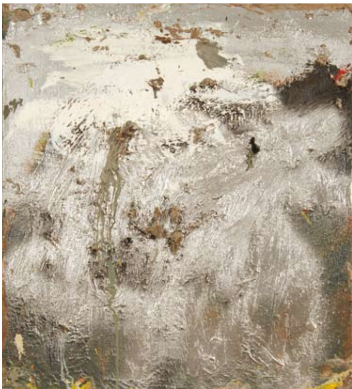
Herbert Brandl, Ohne Titel , 1990/91, Öl auf Leinwand

Zwei neu erworbene Instrumente, ein Harmonium sowie eine Volksharfe erweitern die Musiksammlung. Das Harmonium stammt aus der Pfarrkirche Achenkirch und wurde um 1850 in der Werkstatt von Peter Titz „k.k. Hof Harmonium-Fabrikant und Orgelbauer Wien“ hergestellt. Aus der Werkstatt der Tiroler Harfenbauer-Dynastie Sappl kommt die Volksharfe. Sie wurde um 1920 geschaffen und konnte aus Privatbesitz käuflich erworben werden.