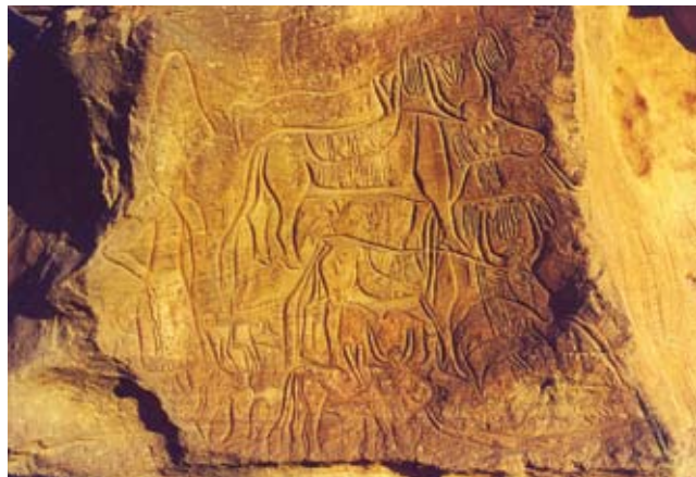
Felsgravur im Wadi Tidoua/Messak Mellet - Libyen: Frau mit geschmückten Rindern und Hunden. Neolithikum/Jungsteinzeit ca. 5.000 v. Chr.

Die Sahara im Fezzan, der südlichsten Provinz Libyens, ist eines der bedeutendsten Felsbildzentren der gesamten Sahara - es gleicht einem prähistorischen Freilichtmuseum. Auf eng begrenztem Raum sind hier in den vergangenen Jahrtausenden - in den heute von Sandwüste umgebenen Gebirgsmassiven/Plateaus des Messak Sattafet und Messak Mellet in Wechselwirkung mit dem Klima - Kulturen entstanden und von nachfolgenden wieder abgelöst worden. Die Entdeckung der prähistorischen Felsgravuren in den bis zu 80 Meter tiefen Wadis (Flusstälern) geht auf Heinrich von Barth 1850 zurück. Seit 1976 erforschen dieses einzigartige und zum Teil schwer zugängliche Gebiet Dr. Rüdiger und Gabriele Lutz aus Innsbruck. Sie haben nicht nur eine systematische Dokumentation der oft monumentalen Fels-