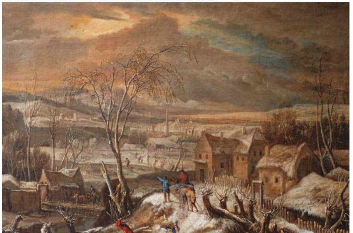
Anton Faistenberger, Winterlandschaft , 17. Jh., Öl auf Leinwand