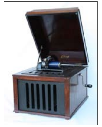
Edison-Phonograph, zum Abspielen eines Tonträgers in Form einer Walze, 1913