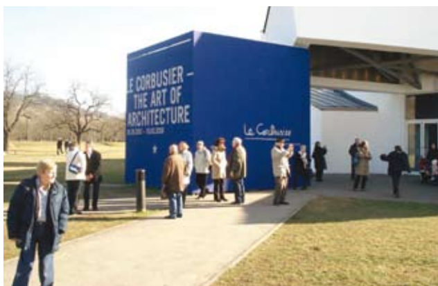
Von der Museumsfahrt am 03.02.08: „Vitra Design Museum“, Le Corbusier Ausstellung