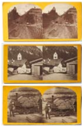
Das Gasthaus „Post“ am Brennerpass Lokomotive „Sterzing“ zum Erdtransport bei den Arbeiten zum Brennerbahnbau.