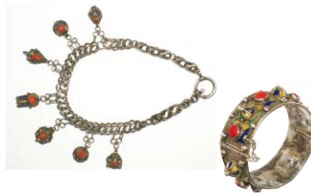
Französische Uhrenkette mit den typischen Kabysten-Anhängern in Cloisonnee Art. Die Basis der runden Anhänger sind französische Silbermünzen

zum Neolithikum gezeigt und damit vielfach Unbekanntes aus unserem gemeinsamen menschlichen Erbe wieder ans Licht geholt und sichtbar gemacht. Silberschmuck sowie Lederarbeiten der Tuareg und farbenprächtiger emailierter Schmuck der Berber spannen den Bogen zum Heute. Zudem sind Originalpräparate ehemals in der Sahara verbreiteter Großsäuger, Reptilien und Vögel zu sehen, die den einstigen Wasserreichtum belegen. Der Besucher hat die Möglichkeit sich als „Felsbildkünstler“ zu betätigen, ein reichhaltiges Rahmenprogramm vermittelt zusätzlich Informationen zum Thema.