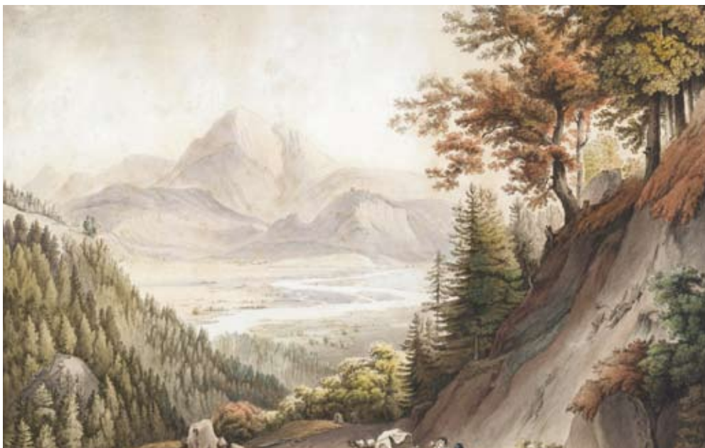
Handkolorierte Umrissradierung „ Ansicht des Lechthales bey Reutti in Tirol “, aus dem Werk von Martin von Molitor „Prospecten aus dem Tirol“, im Verlag des Kunst- und Industrie-Comptoirs zu Wien, 1805 von Duttenhofer gestochen, Ankauf Antiquariat Dieter Tausch, Innsbruck