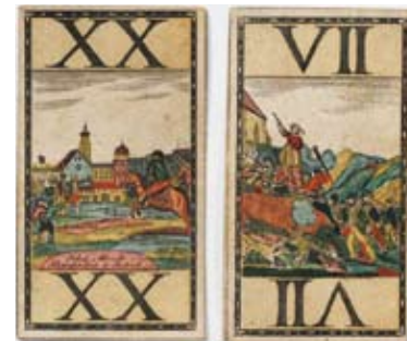
Beispiele der Bildkarten aus dem „Tiroler Tarock“, entworfen von Jakob Plazidus Altmutter, 1810, erschienen bei Johann Albrecht in Innsbruck, um 1815: „XX“ mit der Signatur des Kartenfabrikanten, „VII“ mit der Darstellung des sog. Mädchens von Spinges.

„Was ihr alles sammelt!“ So lautet nicht selten der Kommentar, den man – nach der Veröffentlichung des neuen Jahresberichts des Ferdinandeums – als Mitarbeiterin der Historischen Sammlungen zu hören bekommt. Gemeint sind dabei meist die Objekte des Sammelbereichs der „Alltagskultur“ und hier insbesondere solche, die aus der jüngeren Vergangenheit stammen, also Dinge, die oft keinen besonderen materiellen Wert besitzen. Umso höher sind allerdings der kulturgeschichtliche sowie der Erinnerungswert, die mit solchen Sammelobjekten häufig verknüpft sind und meist dazu führen, dass sich anfängliche Skepsis, wie sie sich etwa im oben zitierten Kommentar ausdrückt, im Gespräch rasch in größtes Interesse verwandelt.