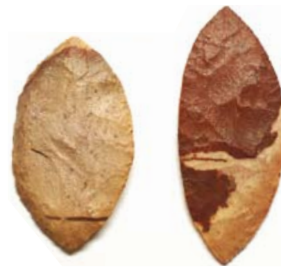
Die Blattspitzen sind Spitzenprodukte des Neolithikums (Jungsteinzeit). Im Abdruckverfahren kleinster Lamellen hergestellt, waren sie wahrscheinlich Kultobjekte.

zum Neolithikum gezeigt und damit vielfach Unbekanntes aus unserem gemeinsamen menschlichen Erbe wieder ans Licht geholt und sichtbar gemacht. Silberschmuck sowie Lederarbeiten der Tuareg und farbenprächtiger emailierter Schmuck der Berber spannen den Bogen zum Heute. Zudem sind Originalpräparate ehemals in der Sahara verbreiteter Großsäuger, Reptilien und Vögel zu sehen, die den einstigen Wasserreichtum belegen. Der Besucher hat die Möglichkeit sich als „Felsbildkünstler“ zu betätigen, ein reichhaltiges Rahmenprogramm vermittelt zusätzlich Informationen zum Thema.