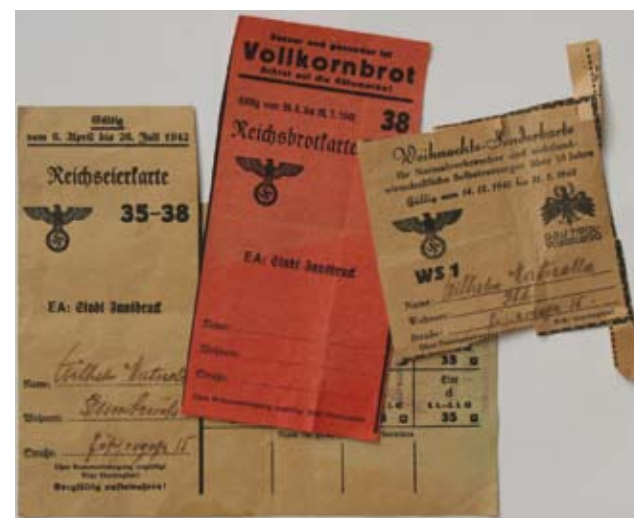
Lebensmittelbezugscheine, hg. vom Gau Tirol-Vorarlberg, 1942

Wie die verschiedenen Ausstellungen im Zeughaus – etwa „Die gelbe Keilhose“, „Das Unsichtbare“, „Nierentisch und Staatsvertrag“, „Verführungskünste“ und „AutomatenWelten“ – in den letzten Jahren gezeigt haben, sind alltagskulturelle Themen beim Publikum sehr beliebt, nicht zuletzt wohl auch deshalb, weil es hier nicht um die „Großen“ und „Berühmten“, sondern um die Geschichte des alltäglichen Lebens, häufig auch um die Erinnerung an unser eigenes Leben geht.