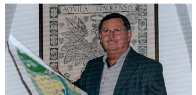
Geboren 1943 in Lienz. Besuch des Bundesrealgymnasiums in Lienz und Studium der Geschichte, Kunstgeschichte und Germanistik an der Universität Innsbruck, Promotion zum Dr. phil. 1968. 1969 Eintritt in das Tiroler Landesmuseum Ferdinandeum als Leiter, ab 1976 Kustos der Historischen Sammlungen. Seit 1986 Leiter des Tiroler Kaiserschützenmuseums. Habilitation 1985 mit der Venia legendi „Kulturgeschichte Europas unter besonderer Berücksichtigung Tirols“. Mitglied der Accademia degli Agiati Rovereto. Mitarbeit und Kurator bei zahlreichen Ausstellungen, u.a. mehreren Landesausstellungen Vortragsstätigkeit, zahlreiche Publikationen zur Geschichte und Kulturgeschichte Tirols.

Eine besondere Aufgabe ist die Betreuung der Bestände des (zurzeit) geschlossenen Tiroler Kaiserschützen-Museums, die mit der Einrichtung der Tiroler Landesmuseen Betriebsgesellschaft m.b.H. den Historischen Sammlungen zugeordnet sind. Eng verbunden mit den Historischen Sammlungen ist der Tiroler Geschichtsverein mit seinem offiziellen Sitz am Tiroler Landesmuseum Ferdinandeum. Seit seiner Gründung im Jahr 1982 verfolgt er in erster Linie die Absicht, das Wissen über die Geschichte des Landes Tirol und der benachbarten Regionen im allgemeinen Bewusstsein der interessierten Bevölkerung zu vertiefen, was durch die Veranstaltung von Vorträgen, Exkursionen, die Herausgabe von Veröffentlichungen und die Pflege des Kontakts mit einschlägigen Institutionen erreicht werden soll.