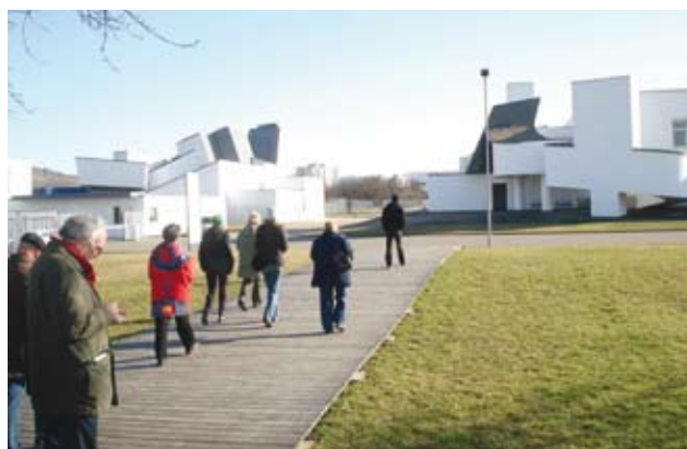
Bauten von Frank O. Gehry