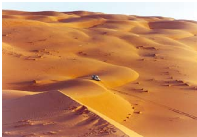
Durchquerung des Dünenmeeres/Erg von Murzuk - Libyen

In der Ausstellung werden die vielfältigen Landschaftstypen der Sahara, Fossilien und die prähistorischen Kulturen mit ihren Felsbildern sowie Artefakte vom Paläolithikum bis-