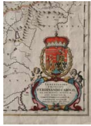
Vignette der Landkarte „TYROLIS COMITATVS“ mit Widmung an den Landesfürsten Erzherzog Ferdinand Karl, Entwurf von Willem Janszoon Blaeu, kolorierter Kupferstich, Amsterdam 1662