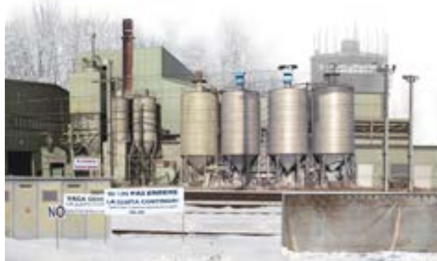
Christine S. Prantauer, raison d'agir 4 , 2012, Digitaldruck, 210 x 130 cm, © Christine S. Prantauer

Die in Zusammenarbeit mit dem kunstforum ferdinandeam durchgeführte Ausstellung raison d'agir der Tiroler Künstlerin Christine S. Prantauer hat die Arbeitsbedingungen, die Arbeitskonflikte und den Widerstand zum Thema. Die Künstlerin zeigt im Studio eine zweiteilige Fotoserie. Diese beinhaltet Bilder von Fabrikanlagen kombiniert mit Transparenten von Demonstrationen und Streiks der letz-