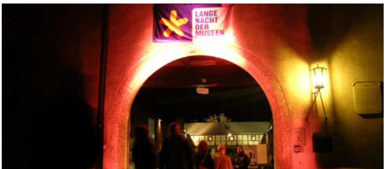
Blick in den Innenhof des Zeughaus bei der LANGEN NACHT DER MUSEEN

Zur Tradition geworden sind zwei Veranstaltungen im Oktober, die mit ihrem bunten Spezialprogramm auf enormen Anklang stoßen: Die „ORF Lange Nacht der Museen“ findet heuer am 6. Oktober statt. Von 18 Uhr bis 1 Uhr in der Nacht werden Führungen in allen Häusern der Tiroler Landesmuseen rund um die aktuellen Ausstellungen und die Schausammlungen geboten. Werkstätten laden Groß und Klein zum Mitmachen ein. RestauratorInnen geben Einblick in ihre Arbeit. Musikalische und szenische Darbietungen, ein Quiz für Kinder sowie Künstlergespräche stehen ebenso auf dem Programm. Im Tiroler Volkskunstmuseum kann man einem Schnitzer bei der Arbeit über die Schulter blicken. Im Museum im Zeughaus wird ab 22.30 Uhr der Tanzboden ausgerollt, Peter Alexander und die Bee Gees lassen grüßen! Am Nationalfeiertag, 26. Oktober, öffnen die Tiroler Landesmuseen bei freiem Eintritt von 9 bis 17 Uhr ihre Türen. Geboten werden über 50 Programmpunkte. Details zu den beiden Veranstaltungen sind zeitgerecht unter www.tiroler-landesmuseen.at zu finden.