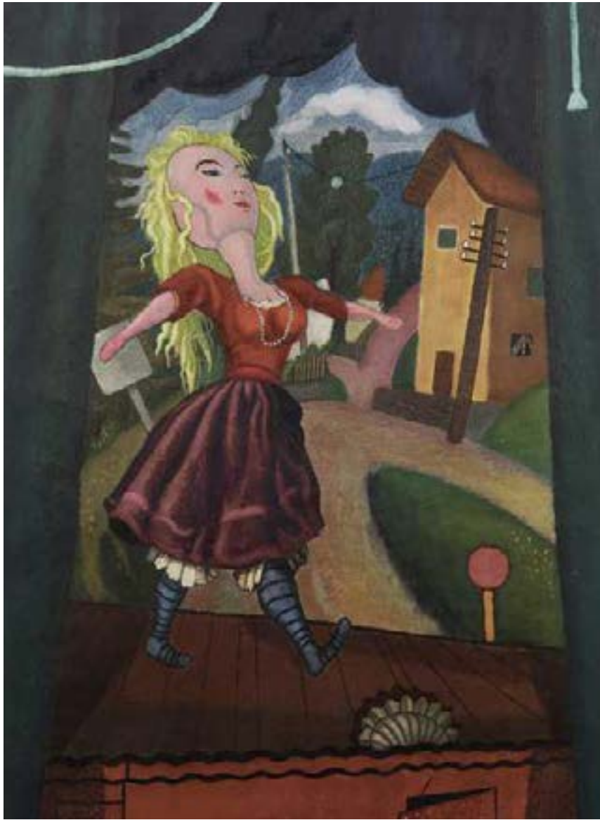
Rudolf Wacker, Die hysterische Puppe, 1924, Öl auf Leinwand, 62 x 42 cm, Elisabeth Leopold, Wien

Die aktuelle Sommerausstellung „Blickwechsel – Landschaft zwischen Bedrohung und Idylle“ im Tiroler Landesmuseum Ferdinandeum gibt wunderbare Einblicke in das Werk dreier Künstler der Neuen Sachlichkeit bzw. des Magischen Realismus: Franz Radziwill, Franz Sedlacek und Rudolf Wacker. Gezeigt werden mehrere Themenblöcke, die, wie der Titel der Ausstellung signalisiert, Blickwechsel zeigen bzw. zu diesen auffordern. So wird eine Herleitung des Landschaftsbildes in der Neuen Sachlichkeit ausgehend vom Realismus der niederländischen Malerei, über die Romantik unternommen und an Beispielen die Weiterentwicklung nach dem 2. Weltkrieg bis in die Gegenwart veranschaulicht.