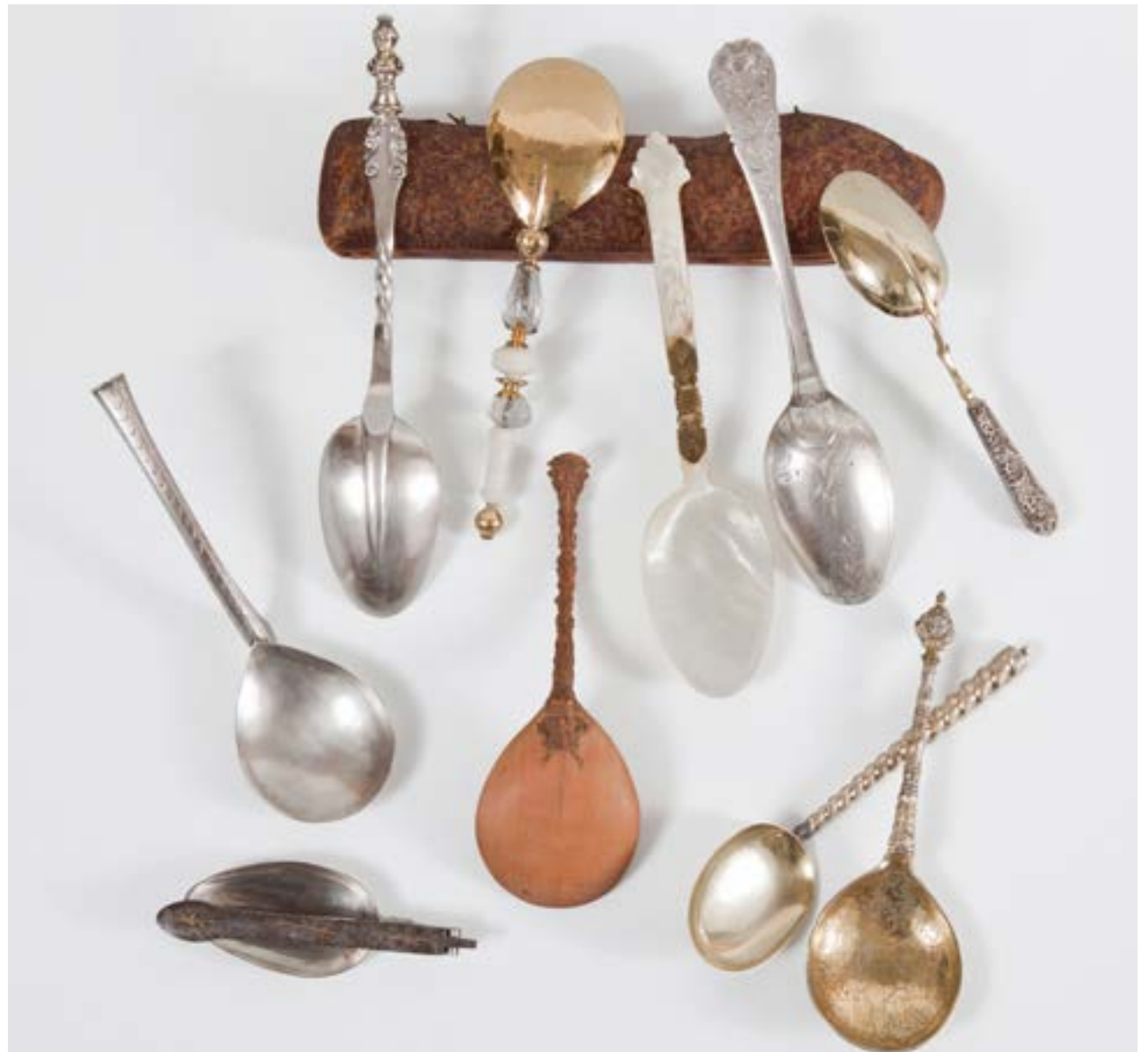
Löffel und Bestecketui, 16./19. Jh.

Im Spätmittelalter brachte der Gast Messer und Löffel selbst mit. Sie steckten in einem am Gürtel befestigten Futteral. Mit dem Messer konnten Fleischstücke nicht nur zerkleinert, sondern auch mit der spitz zulaufenden Klinge aufgespießt und verspeist werden. Häufig wurden beim Essen noch die Finger zu Hilfe genommen. Erst in der 2. Hälfte des 17. Jahrhunderts begann sich die Messerklinge vorne abzurunden, da nun die Gabel die Funktion des Aufspießens übernahm. Der Löffel diente der Aufnahme dünnflüssiger Speisen und Soßen. Er wies eine runde Laffe und einen kurzen, dünnen Stiel auf, der beim Essen mit der ganzen Faust umschlossen wurde. Ende des 17. Jahrhunderts hatte sich der Löffel zu der uns heute bekannten Form entwickelt: Die Laffe war nun oval, der Stiel länger, breiter und leicht geschwungen, damit man ihn zwischen drei Fingern halten konnte. Der Gebrauch der Essgabel setzte sich nur langsam durch. Als Urform kann der Bratspieß – sozusagen eine einzinkige Gabel – angesehen werden, mit dem man das gebratene Stück Fleisch auch zum Mund führen konnte. Im 16. Jahrhundert kamen kleine, gerade, zweizinkige Gabeln zum Aufspießen von Konfekt und Obst in Verwendung. Ein Jahrhundert später wandelte sich die Spieß- zur Kellengabel. Diese erhielt eine dritte und vierte Zinke, der Kellenansatz wurde breiter, sodass nun mit Hilfe des Messers Speisestücke auf die Gabel geschoben werden konnten. Erst jetzt vollzog sich die Vereinigung von Löffel, Messer und Gabel zum Bestecksatz.