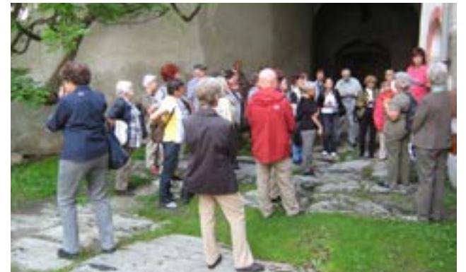
Impression von der Führung durch die Burg Rodeneck mit der Castellanin.

Am 23. Juni hingegen trat eine reisefreudige Gruppe von über fünfzig TeilnehmerInnen die Fahrt nach Südtirol an. Beeindruckt zeigten sich viele von den vielfältigen historischen Banden zwischen den Schlossherrn von Rodeneck, den Bischöfen von Brixen und dem von Bischof Hartmann gegründeten Kloster Neustift.