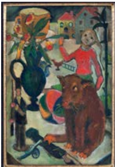
links: Alphons Schnegg, Stillleben, 1924, Öl auf Leinwand, 45 x 29,5 cm, Inv. Nr. Gem/4508, Foto: TLM

Alphons Schnegg (Innsbruck-Mühlau 1895 – Innsbruck 1932) studierte nach dem Ende des 1. Weltkrieges in Wien und München. Anschließend bezog er sein Atelier in Mühlau, wo er Freundschaft mit den ebenfalls in Mühlau ansässigen Malern Ernst Nepo, Rudolf Lehnert und Sidonius Schrom schloss. 1925 wurde er Mitglied der Künstlergruppe „Die Waage“; 1927 schuf er ein Kriegerdenkmal (Fresko) in Mühlau und erhielt den Staatspreis. Nach seinem Tod 1932 wurde ihm im Kunstsalon Unterberger eine Gedächtnisausstellung gewidmet. Schnegg ist in seinen Landschaften und Porträts einem zwischen Spätimpressionismus und Expressionismus stehenden Stil verpflichtet.