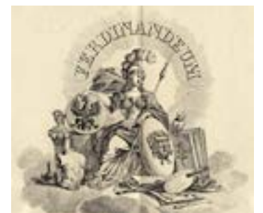
Vignette des ersten gedruckten Mitglieder diploms des Museumsvereins (1825)

mitglied fiel er damit aus. Von allem Anfang an war das Ferdinandeum, eben auch bedingt durch die Höhe des Mitgliedsbeitrags, ein vorrangig bürgerlicher Verein, mit dessen Zielen sich auffallend viele Geistliche, aber auch Adelige identifizieren konnten. Einladungen bzw. Aufforderungen dem „Verein des tirolischen Nationalmuseum[s]“ beizutreten, wurden in den Jahren nach 1823 wiederholt an die Beamten des Kronlandes versandt.