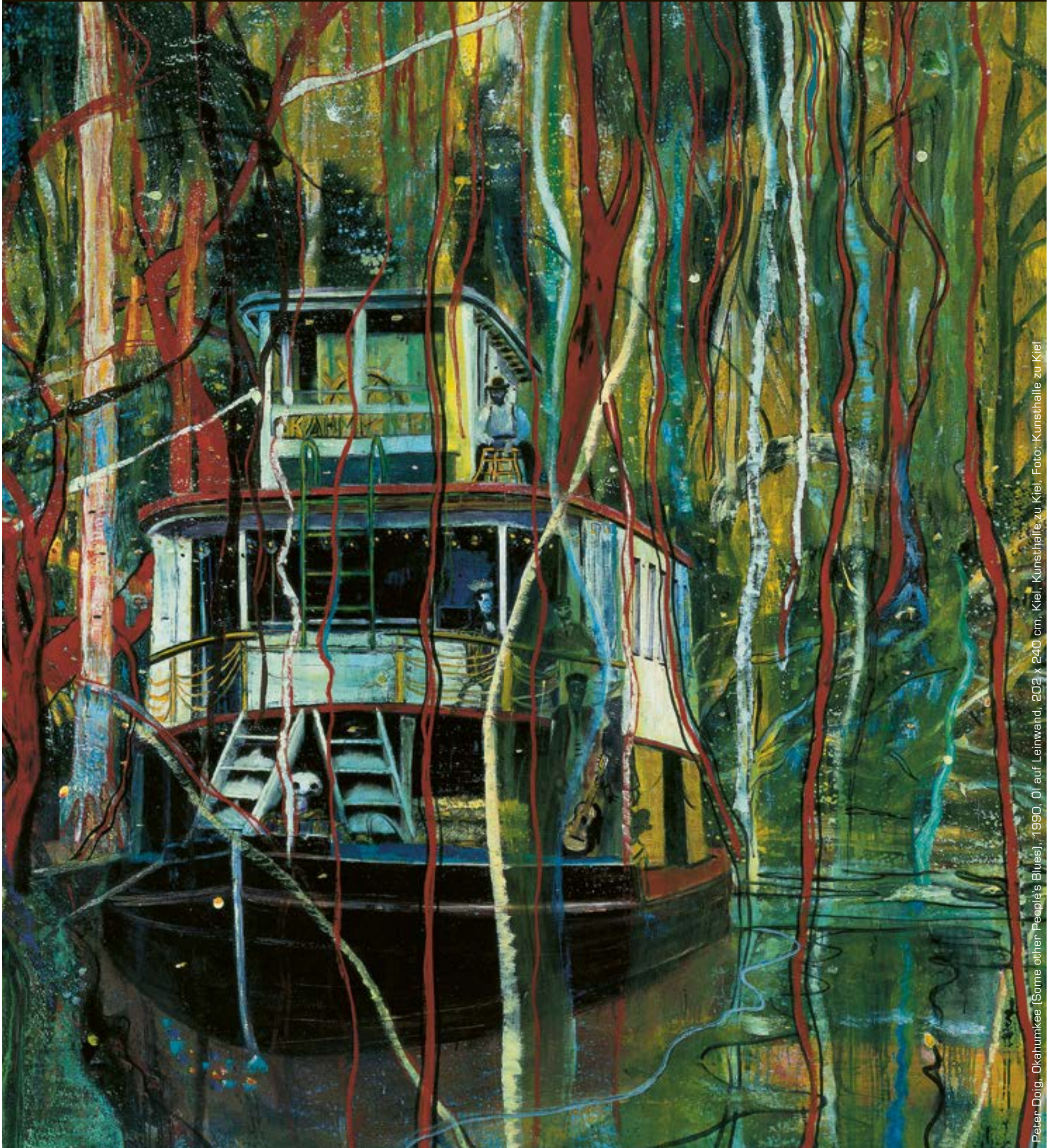
Peter Doig, 'Some other People's Blues', 1990, Öl auf Leinwand, 202 x 240 cm, Kiel, Kunsthalle zu Kiel