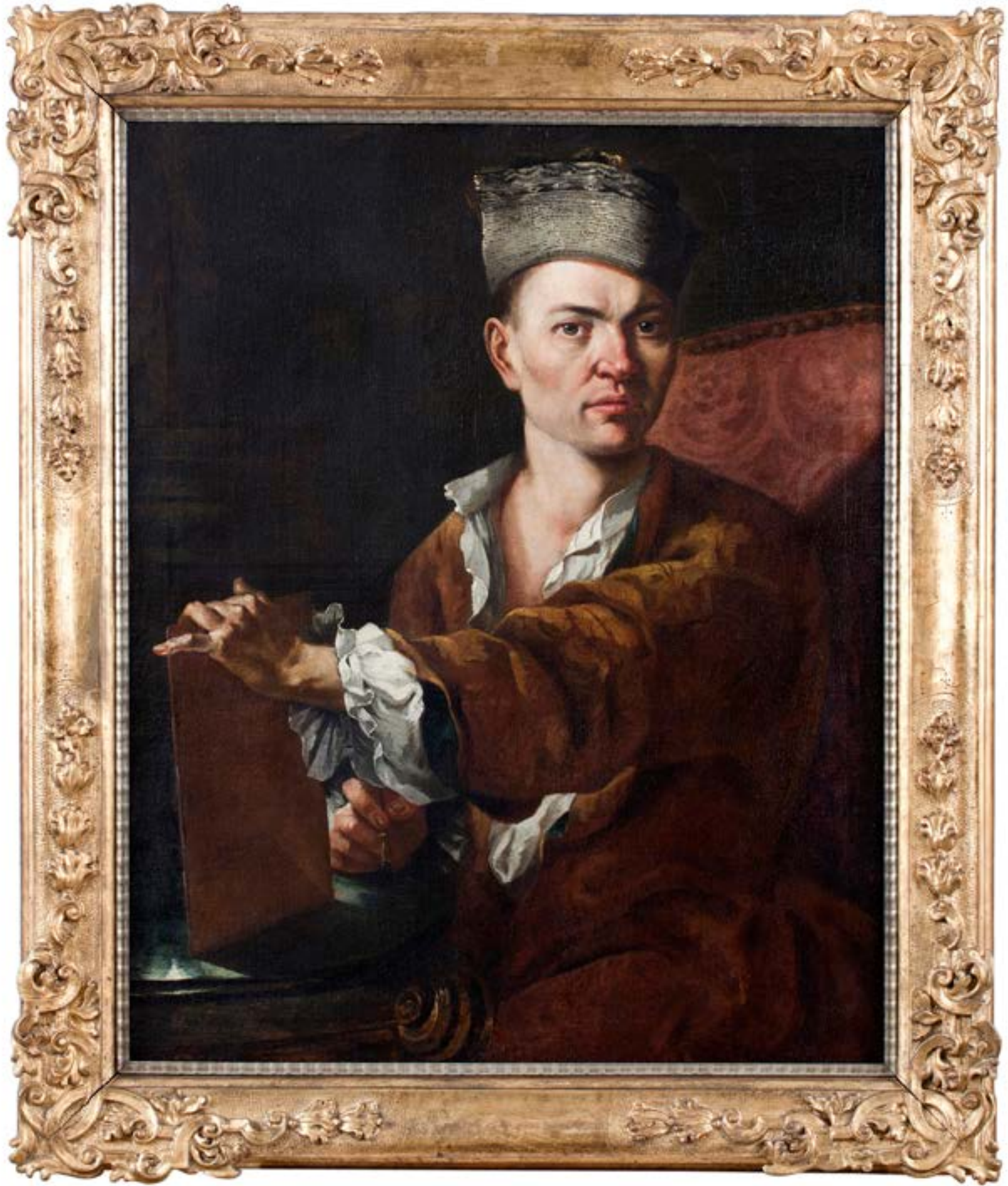
Paul Troger, Selbstbildnis, um 1728, Inv. Nr. Gem 1227, Foto: TLM