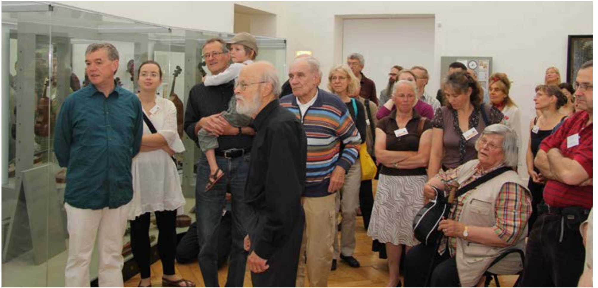
Regel Austausch unter TeilnehmerInnen der Tagung bei der Führung durch die Instrumentensammlung des Ferdinandeums, Foto: TLM