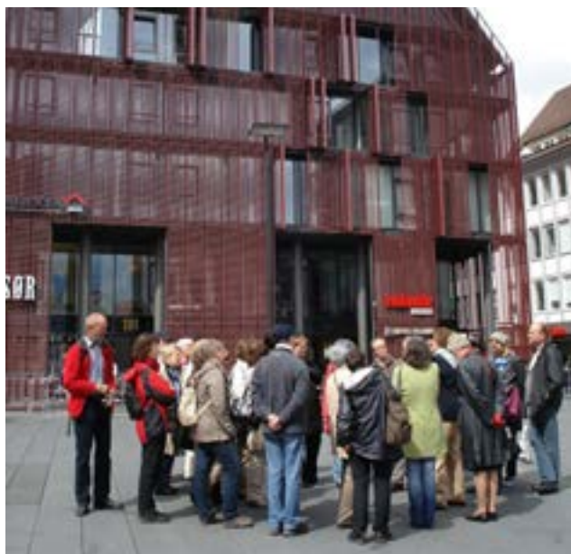
Aufmerksam lauschten die Mitreisenden der Stadtführung.

Am Nachmittag folgte eine geführte Stadtbesichtigung vom Rathaus, ein herausragendes Baudenkmal der Frührenaissance, über das Ulmer Münster, von den Baumeistern Heinrich und Michael Parler erbaut und im Besitz des höchsten Kirchturms der Welt zur Altstadt mit den Fachwerkhäusern und der Stadtmauer.