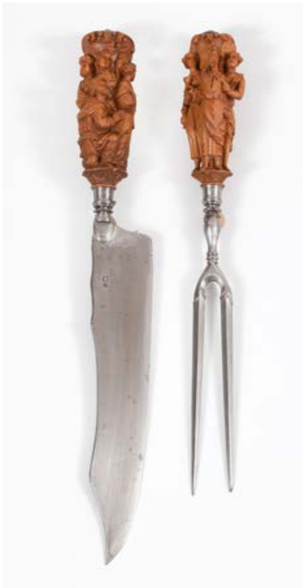
Tranchierbesteck, geschnitzte Buchsbaumgriffe mit biblischen Darstellungen, Südtirol, um 1700, Foto: TLM

Die Älteren Kunstgeschichtlichen Sammlungen des Tiroler Landesmuseums Ferdinandeum bewahren eine stattliche Zahl an Bestecken vom 16. Jahrhundert bis heute. Sie dokumentieren Entwicklung und Formenwandel der Essgeräte der letzten 500 Jahre, die mit Veränderungen der Tischsitten und Esskultur einhergingen.