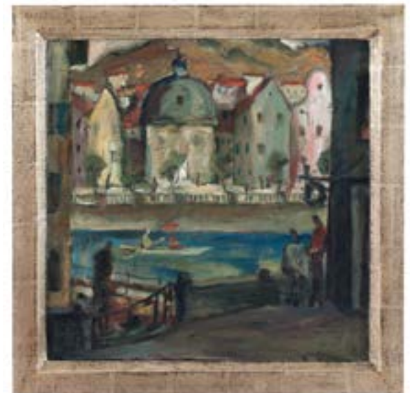
rechts: Alphons Schnegg, Blick auf die Kirche Mariahilf, um 1924, Öl auf Leinwand, 51 x 50,5 cm, Inv. Nr. Gem/5409