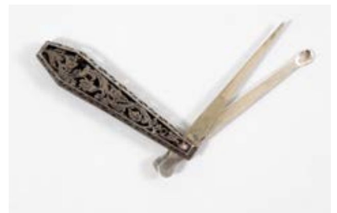
Klappbarer Zahnstocher und Ohrlöffel, Deutsch, 19. Jh., Foto: TLM

Durch die in Mode kommenden Tee- und Kaffeegesellschaften entstanden neue Besteckarten, wie Tee- und Kaffeelöffel, Zuckerzange, Zuckerlöffel, Gebäckzange, Tortenmesser oder Tortenheber. Im Laufe des 19. Jahrhunderts wurden neue Legierungen und Veredelungstechniken entwickelt. Schließlich trat die maschinelle Serienproduktion an die Stelle der in Handarbeit gefertigten Bestecke.