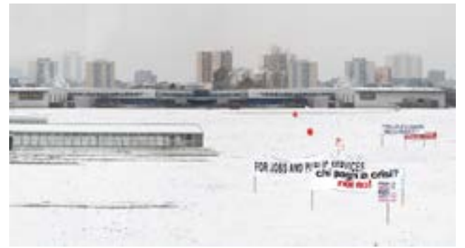
Christine S. Prantauer, raison d'agir 6 , 2012, Digitaldruck, 210 x 130 cm, © Christine S. Prantauer

ten Jahre in unterschiedlichen Ländern. Im ersten Teil der Serie zeigt sich der Widerstand vor dem Hintergrund von Fabriken in wechselnder Umgebung. Der Produktionsort ist austauschbar und richtet sich nach dem Prinzip der Profitmaximierung. Die Proteste gegen Arbeitsbedingungen und Arbeitsplatzverlust sind so global wie die Standorte. Im zweiten Teil der Serie ist die Fabrik aus dem Bild verschwunden, ausgetauscht gegen diffuse Orte. Die Arbeit ist nicht mehr greifbar, nicht mehr verankert an einem bestimmten Ort, die Forderungen und Slogans sind geblieben.